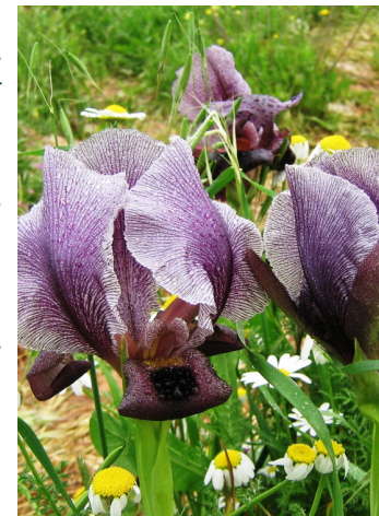
אירוס הגלבוה

שביל האירוסים מתפתל על מורדותיו הדרום-מזרחיים של פסגת ברקן, בתוואי שעולה בין האירוסים הנהדרים אל ראש ההר. על ההר תמצאו עוד מרבדי פריחה שובי עין של פשתה שעירה, נורית אסיה, דמומית ארץ-ישראלית, דרדר כחול, ועוד המון חברים צבעוניים.