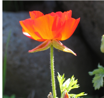
נורית אסיה

הערה: כל טיול ביהודה ושומרון מחייב תיאום ביטחוני (טלפון 02-5305042).