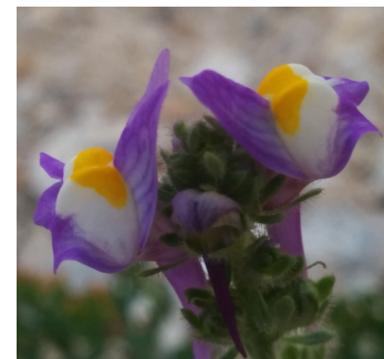
פשתנית ססגונית