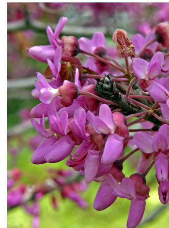
כליל החורש

כיאה לשמו זהו עץ חורש. למרות גודלו הצנוע הוא מספק מופע צבעוני מרשים, במיוחד בחודשי האביב, בדמות כתמים מרהיבים של ורוד-סגול.