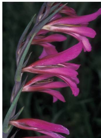
סייפן התבואה