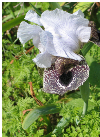
אירוס נצרתי

הגעה למסלול: מכיוון דרום נצרת עילית: מכביש 75 פונים ימינה לרחוב דרך החטיבות. ברמזור השני ממשיכים ישר ברחוב שדרות מעלה יצחק (שדרות מעלה יצחק הוא רחוב ארוך ומקיף את נצרת עילית). ממשיכים ישר וחולפים על פני בית העלמין ועל פני כיכר ובה פסל של סוס ועגלה ומעגל כניסה להר יונה. ממשיכים ישר ועוברים את הכניסה לעין מאהל. מיד לאחר מכן פנייה ימינה - עושים פנייה פרסה בכיכר וחוזרים לכביש הראשי. בצומת מייד פונים שמאלה בנסיעה איטית כדי להבחין בפנייה ימינה לדרך צדדית - שם יש שלט שמפנה לחניה.