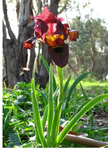
אירוס הארגמן

המעבר משמורה לשמורה פשוט - דרך מעבר להולכי רגל תחת גשר נחל פולג. שמורת שער פולג קטנה ומשולטת, ומוקד העניין בה הוא שער פולג ("השער הרומאי"). השער הוא פרצה חצובה ברכס הכורכר והוא שהעניק לנחל פולג את שמו בכמה שפות. שבילי מטיילים עוברים בפרצה ובראש המצוק.