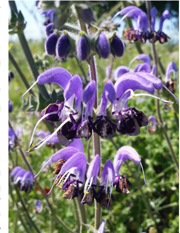
מרווה כחולה

מרווה כחולה היא צמח גבוה יחסית (עד שני מטרים) ופורח בגוון תכלת, סגול וכחלחל. למינים שונים של המרווה מיוחסות סגולות ריפוי רבות, ולכן שמו המדעי של הצמח - סלביה - קשור למילה SALVERE, שפירושה "להבריא".