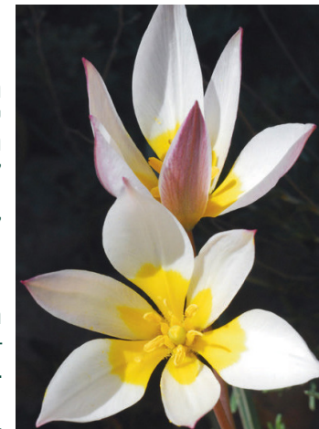
צבעוני ססגוני

כאמור, הר הנגב ואזור מכתש רמון הם המקומות היחידים בעולם שבהם צומח פרח זה, המופיע בגווני צהוב-כתום מבחוף - ולבן או ורוד בעלים הפנימיים. הפרח הקטן והיפה הזה פורח בחודשים פברואר-מרץ.