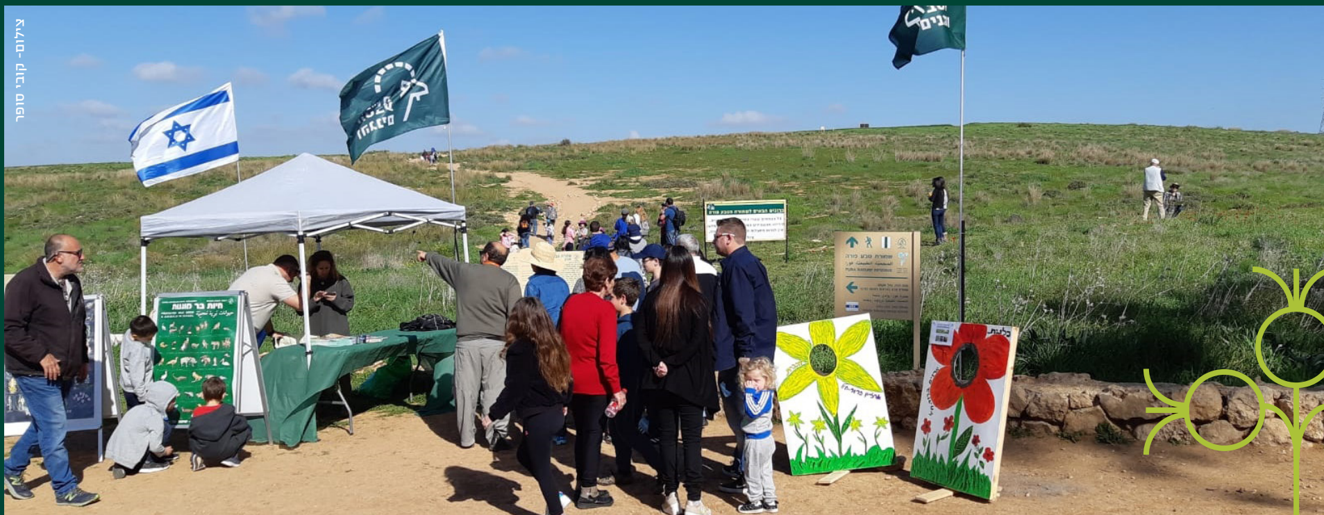
תל אביב - ירושלים - יזרעאל

צמחיית ישראל כוללת מגוון עצום של מינים, ובהם מגוון עצום של פרחים, והיא ידועה בעולם בריכוז המינים הגדול שבה ביחס לשטחה. כמה מהפרחים, כמו כלנית מצויה ורקפת מצויה, נפוצים מאוד בזכות מעמדם כפרחים מוגנים. מעמד זה עוזר לא רק בשמירתם מפני הכחדה אלא גם בשימור מרבדי מינים אלה ואחרים הגדלים באזורים מוגדרים. אנחנו ברשות הטבע והגנים מודעים לחשיבותה של התגייסות הציבור לשמירה על מינים מוגנים, ומשקיעים מאמץ רב בהגברת מודעותו ומעורבותו בשמירה על הטבע. הפרחים המוגנים הם סמל לשמירת הטבע בארץ והצלחה בשימורם ידועה בארץ ומהווה דגם לשימור בכל העולם. זוהי הצלחה הסברתית אדירה. לא פעם מבקרים מחו"ל משתאים בראותם מרבדי פרחים בשטחים פתוחים