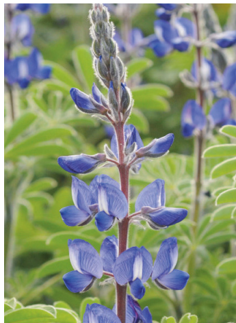
תורמוס ההרים

הערה: כדאי להצטייד בנעליים או בסנדלים להליכה במים.