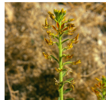
באשן שלוש העורקים

מילה על פשתנית ססגונית: פשתנית ססגונית היא צמח מרשים, הממזג יחדיו