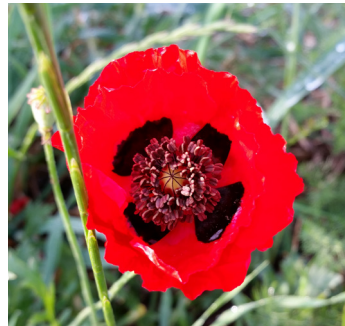
פרג אגסני

מילה על נורית אסיה: נורית אסיה היא גיאופיט הפורח בצפון ישראל ובמרכזה בחודשים מרץ-אפריל. פריחתו אדומה ומרשימה. עלי הכותרת מבריקים בברק מתכתי עז.