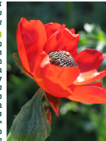
נורית אסיה

למשפחת הנוריתיים משתייכים מאות מינים, והם מתהדרים בצבעים שונים. בישראל צבעה של הנורית אסיה אדום מבריק ונהדר, והיא פורחת בחודשים פברואר-מרץ.