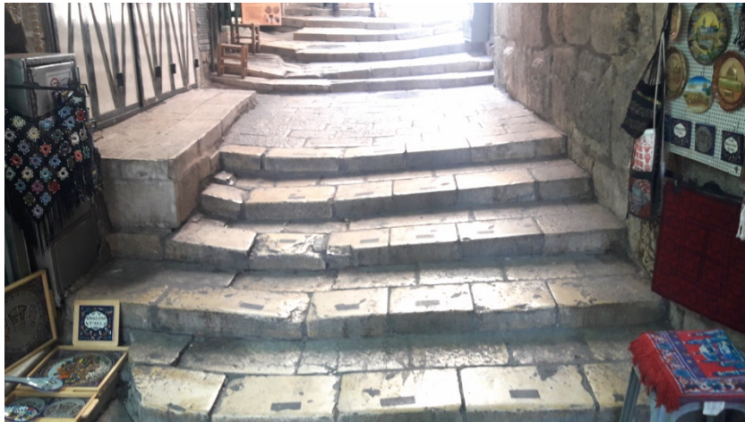
תמונה 19: מדרגות אבן שקועות בויה דלורוזה

באזור שער שכם, נוסף על ריכוזי האשפה שתוארו לעיל, נמצאו רחבות שחוקות ומוכתמות וסימון מחוק שלמעבר חצייה. ברחוב בית הבוד, באזור הסמוך לשער שכם, חסרות אבני ריצוף רבות.