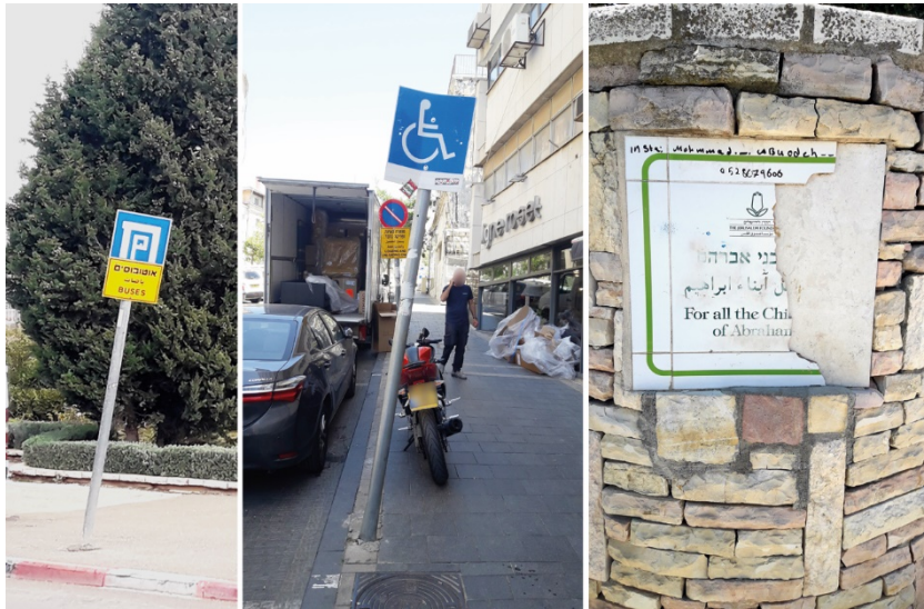
מימין - בגן הפעמון; באמצע - במרכז העיר; משמאל - ליד משכן הכנסת.

בשוק מחנה יהודה, נוסף על היעדר שלטי רחוב שתואר לעיל, נמצאו כמה שלטים בלויים או מותקנים בצורה רשלנית. כמו כן, אחת משתי המפות של השוק, המוצבת באחת מהכניסות אליו, הושחתה.