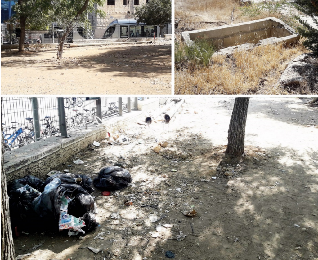
למעלה מימין - גן מחבר בין מוזיאון ישראל למוזיאון המדע, מול משכנה הכנסת; למעלה משמאל לולמטה - אזור התחנה המרכזית.