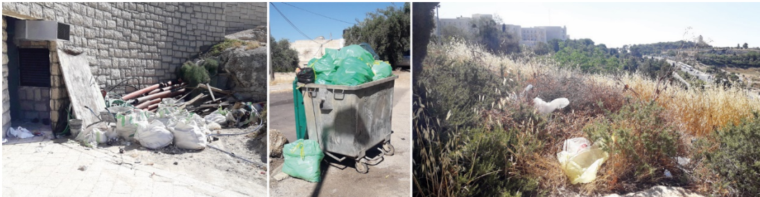
תמונה 29: פסולת בנייה ואשפה לאורך טיילת הר הצופים

לעומת זאת, יש לציין לחיוב שתצפית הר הזיתים נמצאה נקייהבכל הספורים שערכו בה נציגי משרד מבקר המדינה.