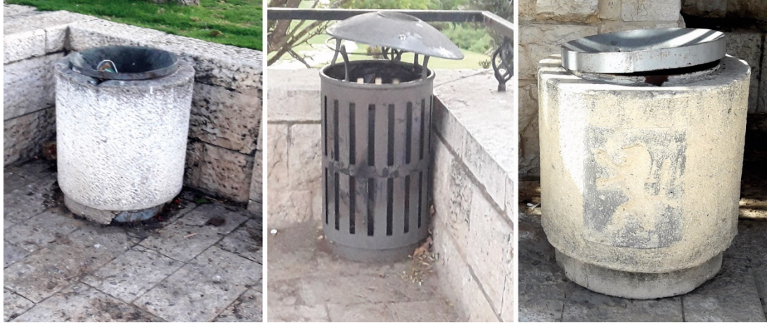
תמונה 30 : פחיאשפהבטיילתארמוןהנציב