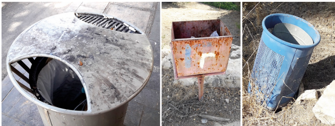
מימין ובאמצע - פחי אשפה בגן המחבר בין מוזיאון ישראל למוזיאון המדע, מול כנסת ישראל; משמאל - פח אשפה מטונף ביציאה מהתחנה המרכזית.