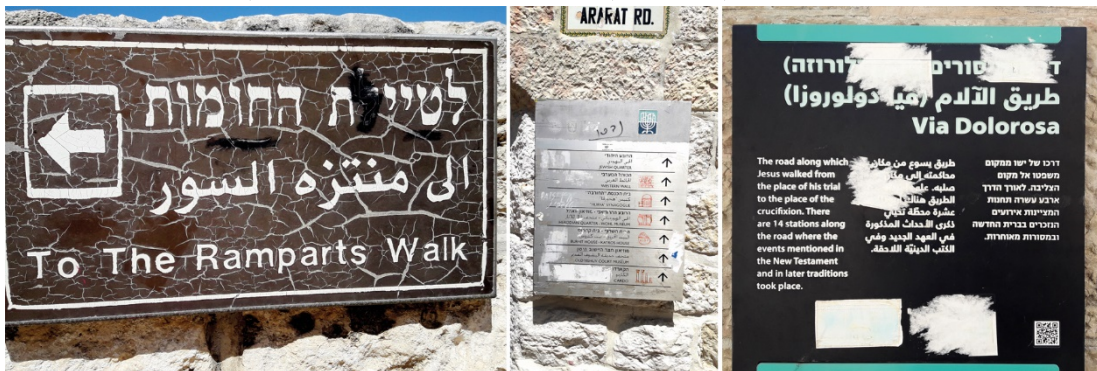
תמונה 4: ליקויי תחזוקה בשלטים ברחבי העיר העתיקה

כמו כן נמצאו תמרורים פגומים ומלוכלכים בסביבת שער ציון ושער יפו, עמודים נטויים, שלטים מעוקמים ושלטים מכוסים במדבקות.