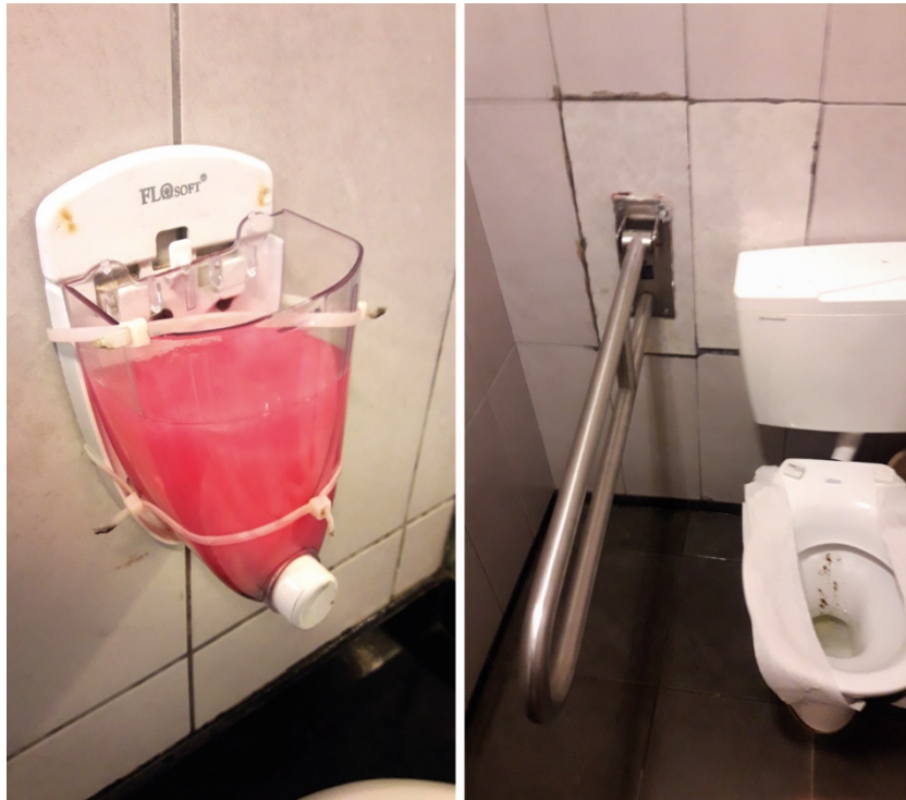
מחסור בציוד מתכלה חיוני

מצב קשה במיוחד של מחסור בנייר טואלט היהבבש"צים ברחבי העיר העתיקה. יצוין כי הדבר חזר על עצמו בשני הסיורים שערכו נציגי משרד מבקר המדינה בהפרש של חצי שנה. להלן פירוט: בחלק מהתאים בשירותים הסמוכים לכותל היה חסר נייר טואלט ובחלק מהתאים מחזיקי נייר הטואלט נמצאו פתוחים או אף הרוסים; בבש"צ ברחוב תפארת ישראל בשלושה מבין ארבעת התאים היה חסר נייר טואלט; נייר לא נמצא בשום תא בבש"צ ליד שער האריות וברחוב שער השלשלת ובשירותי הגברים בכיכר מוריסטן. בשער יפו לא נמצא נייר טואלט אף לא באחד מארבעת התאים בבש"צ לנשים, ובבש"צ לגברים נמצא נייר טואלט רקבאחד משני התאים.