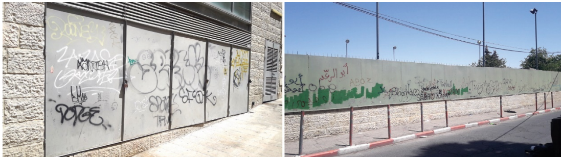
מימין - בדרך שכס, סמוך לקונסוליה האמריקאית ולקתדרלת ג'ורג' הקדוש; משמאל - ברחוב יפו.