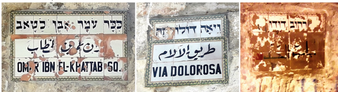
תמונה 5: שלטים פגומים המציינים את שמות הרחובות בעיר העתיקה

בתשובתה למשרד מבקר המדינה מדצמבר 2018 הודיעה הרל"י כי היא פועלת בשיתוף עם עיריית ירושלים לתקצוב פעולות תחזוקת השלטים בעיר העתיקה ברמה שלא רק תאפשר את תחזוקת השבר, אלא גם את "תחזוקת המנע ואף [את] נקיונם [של השלטים] לעיתים קרובות יותר".