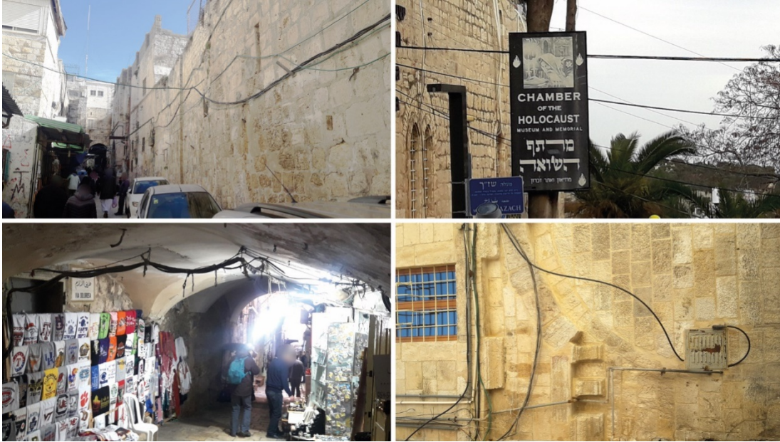
למעלה מימין - בהר ציון ; למעלה משמאל - ברחוב הגיא ; למטה מימין - ליד הכניסה למתחם כנסיית הקבר ; למטה משמאל - בירידה של ויהדולרוזה בין השוק לרחוב הגיא.

עיריית ירושלים מסרה בתשובתה מינואר 2019 כי במסגרת שדרוג המרחב הציבורי בעיר העתיקה היא מטפלת גם בחזיתות המבנים ובתשתיות הגלויות על פני החזיתות והקמרונות.