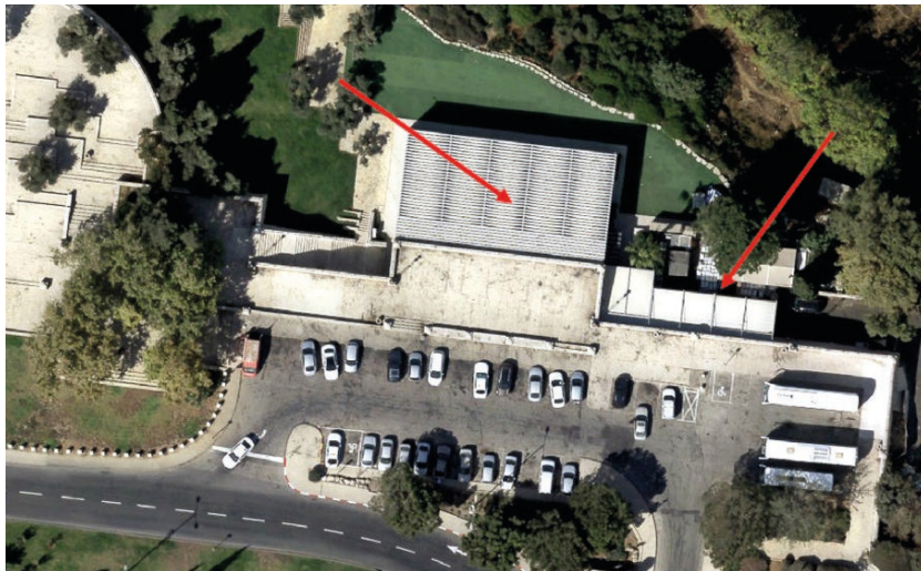
תמונה 37: תצלום אוויר מ-2017

החץ מצד ימין - הקמת קירוי ומבנים על שטח ציבורי פתוח; החץ במרכז התמונה - הפרגולה שמתחתיה המבנה הגדול לאולם האירועים. (עיבוד של תצלום מתוך מערכתתה-GIS העירונית)