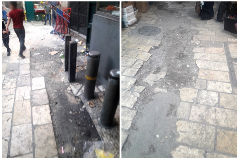
תמונה 20: אבני ריצוף חסרות ברחוב בית הבוד, באזור שער שכם

כמו כן, הכביש המוביל לשער ציון בתוך העיר העתיקה נמצא סדוק ומלא טלאים.