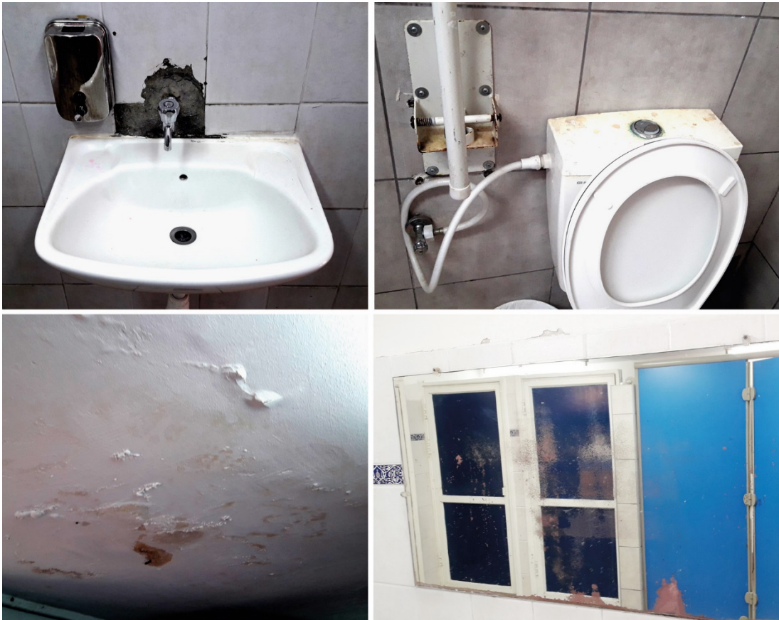
תמונה 52: הבש"צים בגן הסוס

שוק מחנה יהודה: עליבות, דלות ותחזוקה ירודה אפיינו את רוב הבש"צים בשוק מחנה יהודה אשר בשנים האחרונות הפך לאחת האטרקציות התיירותיות המובילות בירושלים. לצד מפגעי ניקיון ורצפות מוצפות נמצאו גם מקרים של סבוניות שבורות, אריחי קרמיקה חסרים או שבורים, כלים סניטריים שבורים, ידיות חסרות ושיפוצים מאולתרים כ"טלאי על טלאי". xxiii