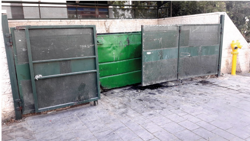
מימין - ברחוב פייר ואן פאסן מול מלון; משמאל - בדרך שכס; למטה - ברחוב יפו, לא הרחק מהתחנה המרכזית.