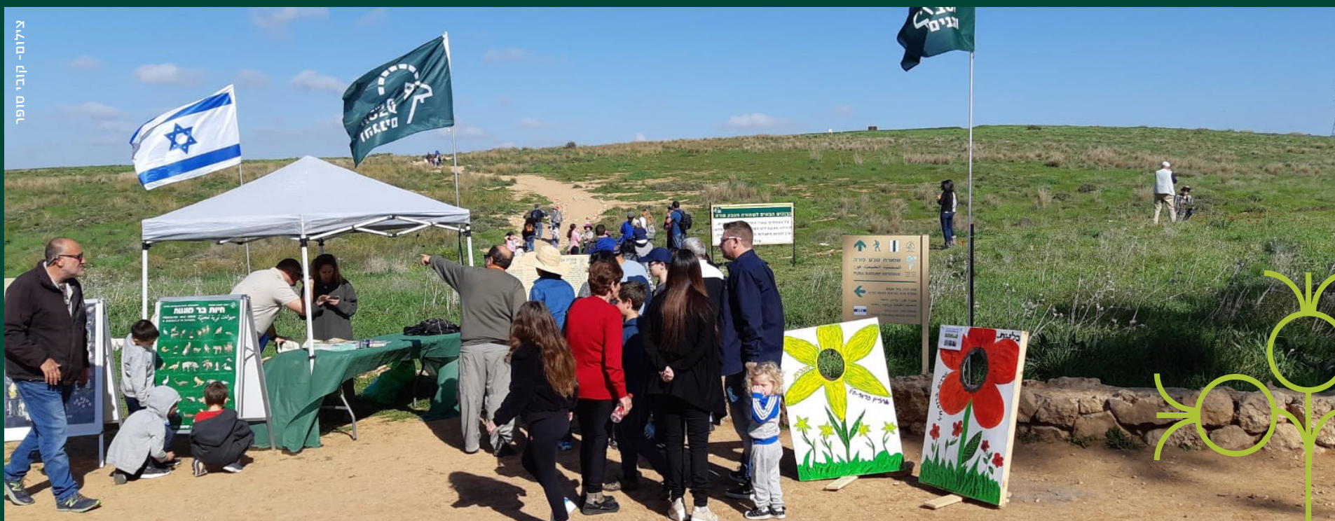
תל אביב - ירושלים - יזרעאל

צמחיית ישראל כוללת מגוון עצום של מינים, ובהם מגוון עצום של פרחים, והיא ידועה בעולם בריכוז המינים הגדול שבה ביחס לשטחה. כמה מהפרחים, כמו כלנית מצויה ורקפת מצויה, נפוצים מאוד בזכות מעמדם כפרחים מוגנים. מעמד זה עוזר לא רק בשמירתם מפני הכחדה אלא גם בשימור מרבדי מינים אלה ואחרים הגדלים באזורים מוגדרים. אנחנו ברשות הטבע והגנים מודעים לחשיבותה של התגייסות הציבור לשמירה על מינים מוגנים, ומשקיעים מאמץ רב בהגברת מודעותו ומעורבותו בשמירה על הטבע. הפרחים המוגנים הם סמל לשמירת הטבע בארץ והצלחה בשימורם ידועה בארץ ומהווה דגם לשימור בכל העולם. זוהי הצלחה הסברתית אדירה. לא פעם מבקרים מחו"ל משתאים בראותם מרבדי פרחים בשטחים פתוחים