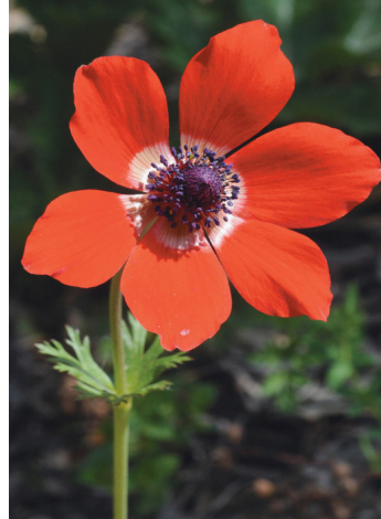
כלנית מצויה

מהחניון נמתח שביל בסימון ירוק אל לב השמורה היפה. לאחר כ-600 מטרים יוצאים מהשמורה לדרך לכלי רכב. עוד כמה מאות מטרים ומגיעים לנקודת תצפית על מאגר פורה, הלוכד את מימי נחל פורה ומתמלא בדרך כלל בימי החורף.