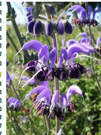
מרווה כחולה

מרווה כחולה היא צמח גבוה יחסית (עד שני מטרים) ופורח בגוון תכלת, סגול וכחלחל. למינים שונים של המרווה מיוחסות סגולות ריפוי רבות, ולכן שמו המדעי של הצמח - סלביה - קשור למילה SALVERE, שפירושה "להבריא".