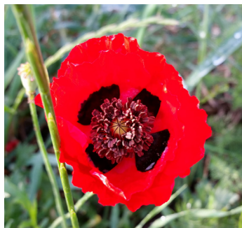
פרג אגסני