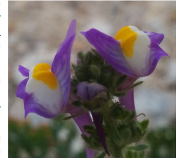
פשתנית ססגונית