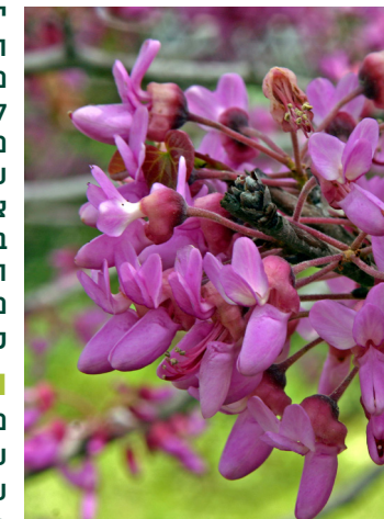
כליל החורש

כיאה לשמו זהו עץ חורש. למרות גודלו הצנוע הוא מספק מופע צבעוני מרשים, במיוחד בחודשי האביב, בדמות כתמים מרהיבים של ורוד-סגול.