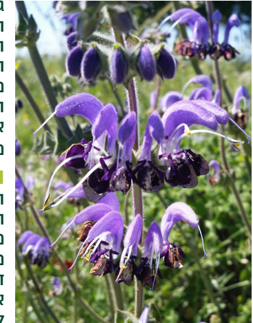
מרווה כחולה

מרווה כחולה היא צמח גבוה יחסית (עד שני מטרים) ופורח בגוון תכלת, סגול וכחלחל. למינים שונים של המרווה מיוחסות סגולות ריפוי רבות, ולכן שמו המדעי של הצמח - סלביה - קשור למילה SALVERE, שפירושה "להבריא".