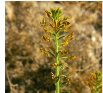
באשן שלוש העורקים

מילה על פשתנית ססגונית: פשתנית ססגונית היא צמח מרשים, הממזג יחדיו כמה צבעים ולו פרחים גדולים, יחסית. הוא פורח בסגול, צהוב ולבן בחודשים ינואר-אפריל.