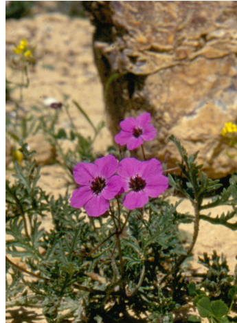
מקור חסידה שעיר